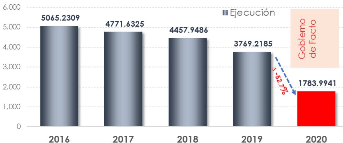
GRÁFICO N°1 EJECUCIÓN PRESUPUESTARIA DE LA INVERSIÓN PÚBLICA 2016-2021 (EXPRESADO EN MILLONES DE DE DÓLARES)

FUENTE: Viceministerio de Inversión Pública y Financiamiento Externo