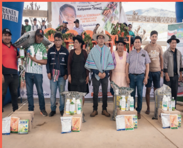
Entrega paquete tecnológico para cultivo de zanahoria, Municipio de Yamparárez.