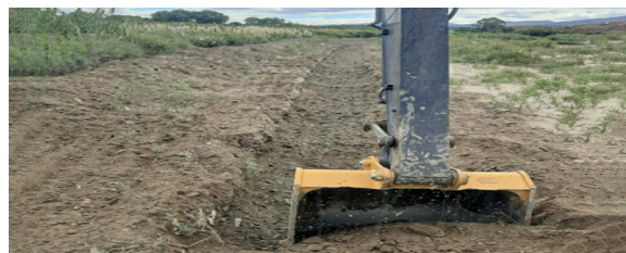
GAM CARRERAS, Rehabilitación y Protección de terrenos productivos en las comunidades de Las Carreras y Monte Sandoval.