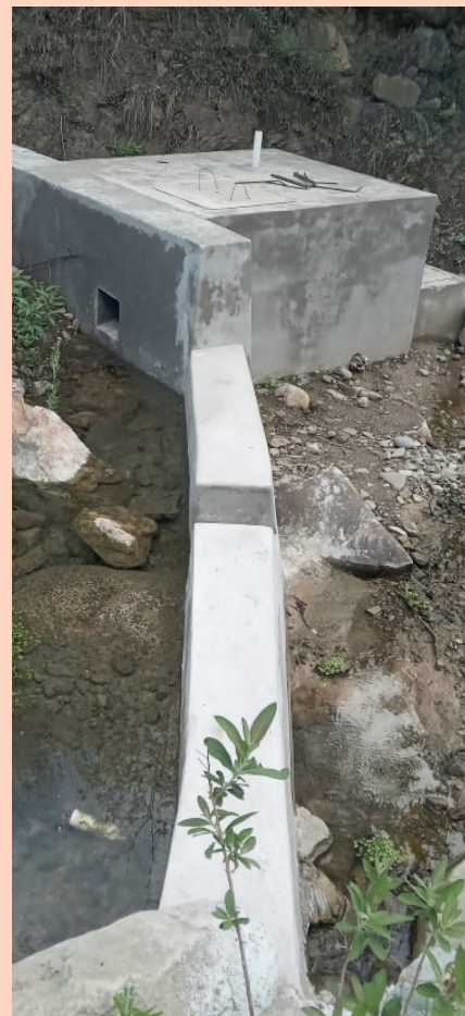
GAM INCAHUASI: Construcción Sistema de Riego El Quemado.