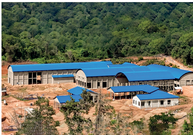
MONTEAGUDO , Industria de Productos del Chaco. Inversión: Bs141,06 millones.