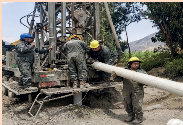
GAM MACHARETI: Comunidad Virgen del Carmen.