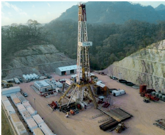
Exploración Pozo Yapucaiti-X1 en Chuquisaca (Hernando Siles) Inversión: Bs623,57 millones.