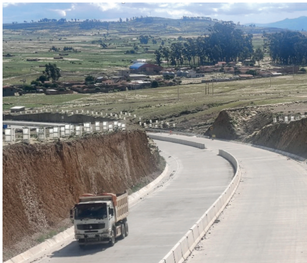
Construcción Doble Vía Sucre - Yamparáez Inversión: Bs528,50 millones.