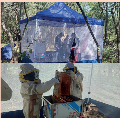
GAM MACHARETI: Implementación de Producción Apícola en 17 comunidades (TPP).