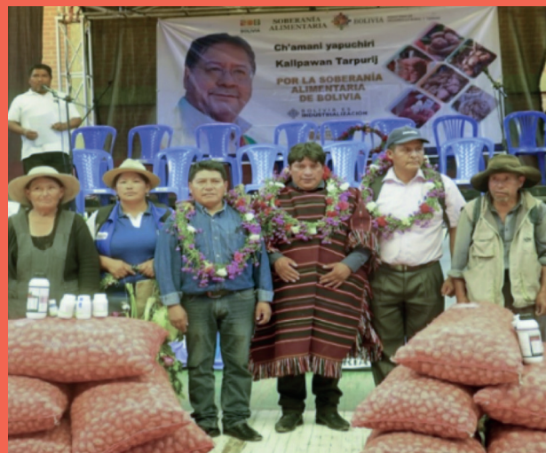
Entrega de insumos agrícolas (Semilla de papa, fertilizantes e Insumos Fitosanitarios), Municipio de Villa Charcas.