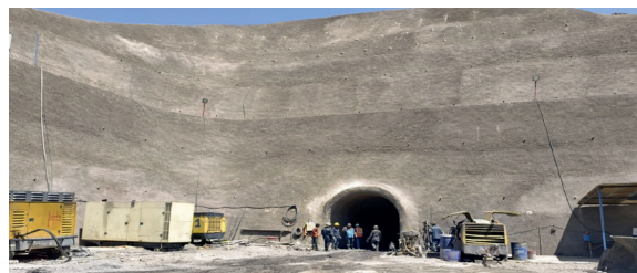
GAM SUCRE, Construcción Sistema de Impulsión y Aducción Ravelo.