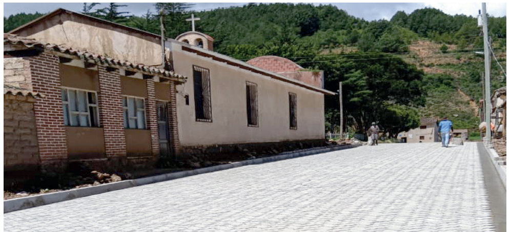
CONSTRUCCIÓN ENLOSETADO CALLES CONSOLIDADAS CENTRO POBLADO MENDOZA - MUNICIPIO DE VILLA SERRANO.