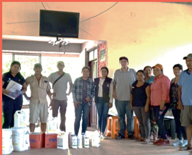
Entrega de insumos químicos y fertilizantes a productores, en la Comunidad de Tiguipa Pueblo, Municipio de Machareti.