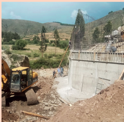
GAM TARABUCO: Construcción Puente Vehicular Chaqueri - Paredon.