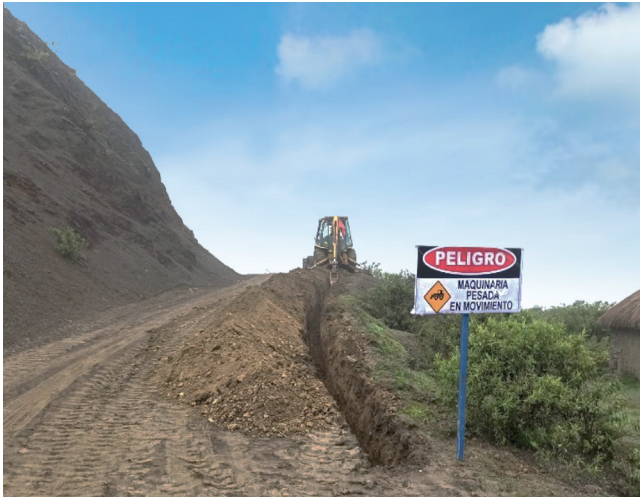
GAM INCAHUASI: Construcción Sistema de Riego Comunidad Pucara de Yatina.