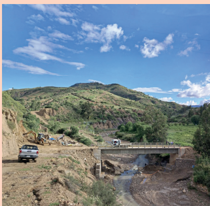
GAM POROMA: Construcción Puente Vehicular Comunidad Sijcha Baja.