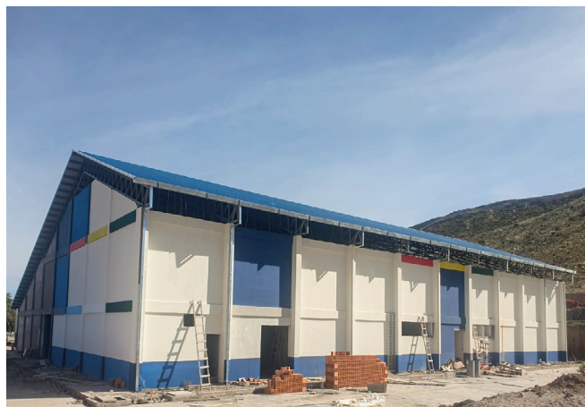
CULPINA , Planta de Industrialización de Frutas de Los Cintis. Inversión: Bs77,43 millones.