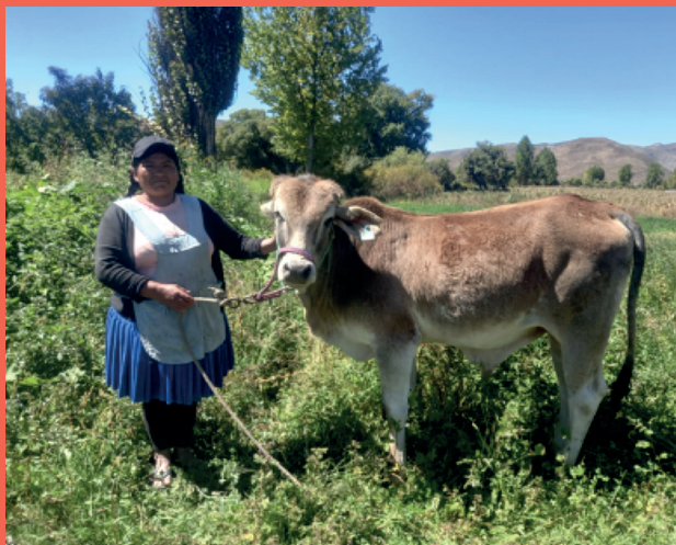
Entrega de torillos para engorde a productores de la Asociación de Productores Lecheros (APLMY), Municipio de Yotala.