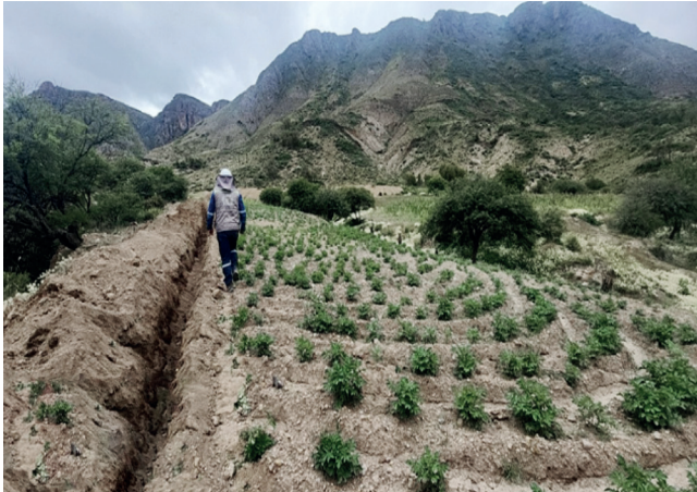
GAM YAMPARÁEZ: Ampliación Sistema de Riego San José de Molles - San Antonio.

El Programa de Alianzas Rurales - PAR III , tiene por objeto incrementar el ingreso de los productores agropecuarios rurales, priorizando a los que tienen mayor grado de vulnerabilidad, dotándolos de conocimientos y medios para insertarse de manera sostenida y competitiva en el mercado. En el marco de este programa el Departamento de Chuquisaca se beneficia con una inversión de Bs29,30 millones , para la ejecución de 15 proyectos distribuidos en 12 municipios.