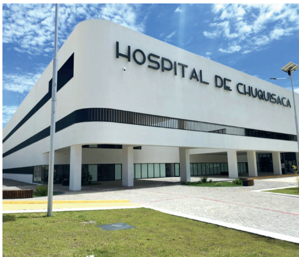
Construcción con equipamiento del Establecimiento de Salud Hospitalario de Tercer Nivel Inversión: Bs514,00 millones.