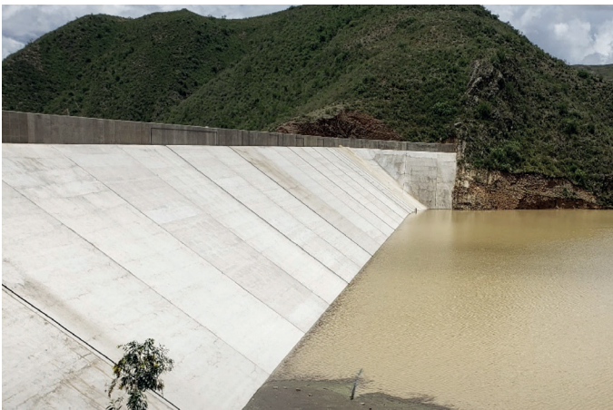
CONSTRUCCIÓN PRESA Y SISTEMA DE RIEGO VALLES - MUNICIPIO DE TARABUCO.