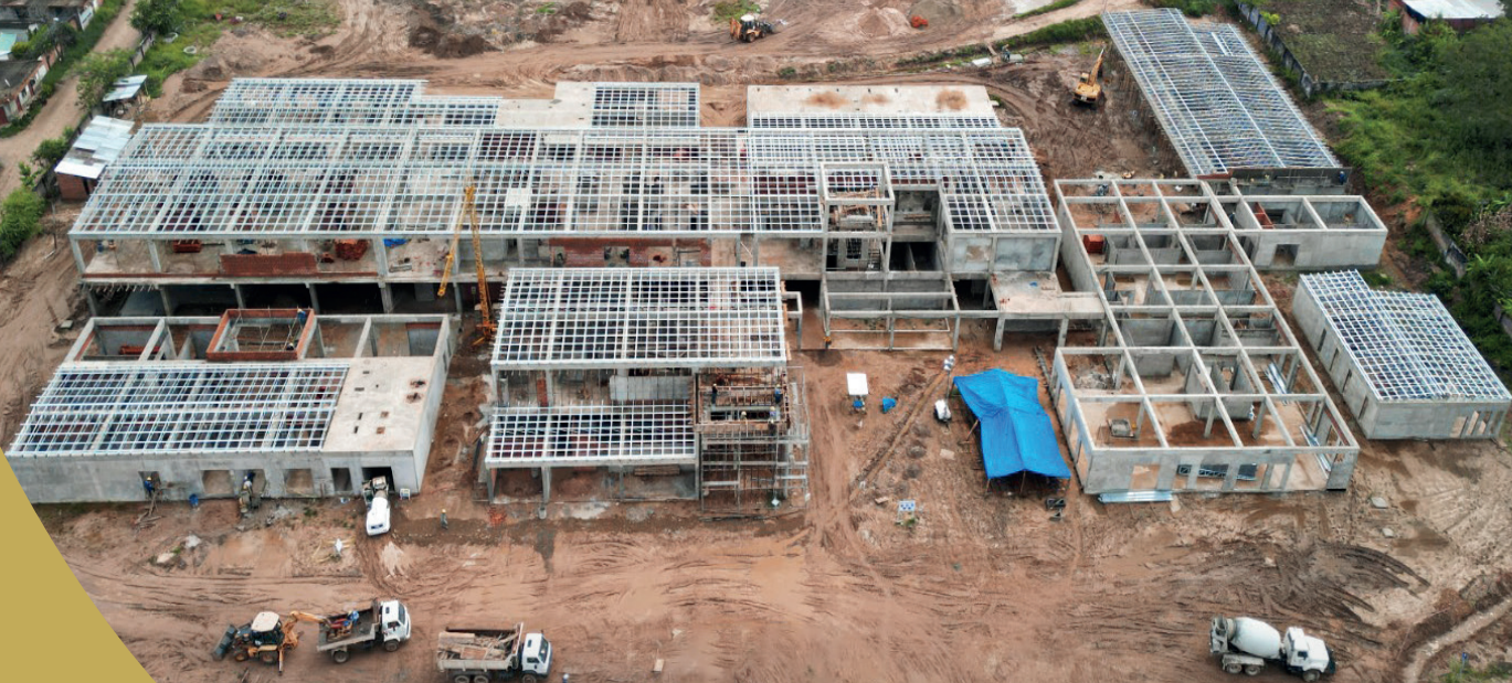
CONSTRUCCIÓN HOSPITAL DE SEGUNDO NIVEL, MONTEAGUDO.