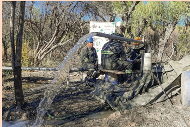
GAM CAMARGO: Comunidad Carusla 1 y 2.

A través del Programa Nacional de Perforación de Pozos de Aguas Subterráneas “Nuestro Pozo” financiado con recursos del Tesoro General de la Nación-TGN, tiene por objeto la implementación de sistemas de agua de pozo, destinado para el consumo animal (bovinos, ovinos y camélidos) y riego de cultivos agrícolas, el cual, para el Departamento de Chuquisaca, se destina en 10 municipios, beneficiando a 2.823 habitantes, con una inversión total de Bs4,41 millones .