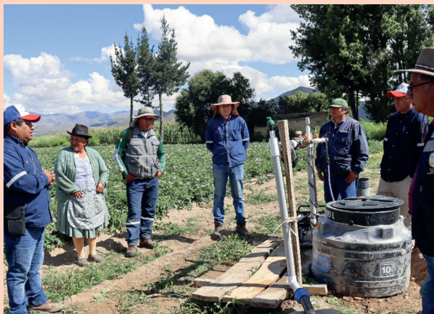
Municipio de Culpina.

A través del Programa Rumbo a la Soberanía Alimentaria con Tecnología de Riego, se financia Bs19,37 millones , destinados a 24 Transferencias Público - Privadas que beneficiarán a 570 productores de 4 municipios.