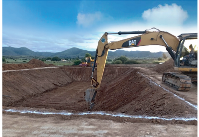
GAM VILLA MOJOCOYA: Construcción de Atajados con Geomembrana para Sistemas de Riego en 4 comunidades.