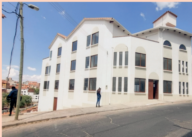
Municipio de Sucre.

La Unidad de Proyectos Especiales (UPRE), dependiente del Ministerio de la Presidencia, destina Bs11,08 millones para Transferencias Público - Privadas en beneficio de 3 municipios del Departamento de Chuquisaca.