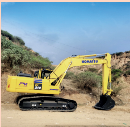
GAM YOTALA: Equipamiento con Maquinaria Pesada Excavadora.

El Fondo de Desarrollo Indígena (FDI) , tiene la finalidad de gestionar, financiar, ejecutar de manera directa, y fiscalizar programas y proyectos para el desarrollo productivo de los pueblos indígena originario campesinos y comunidades interculturales y afrobolivianas, en el territorio nacional. Para el Departamento de Chuquisaca, entre las carteras 3 y 4, se tienen registrados 61 convenios de financiamiento, dentro de los cuales se cuenta también con transferencias público - privadas, los proyectos se distribuyen entre: proyectos de maquinaria y equipo de producción, puentes, riego y productivos; el impacto llega a 29 municipios del departamento, por un importe total de Bs89,17 millones .