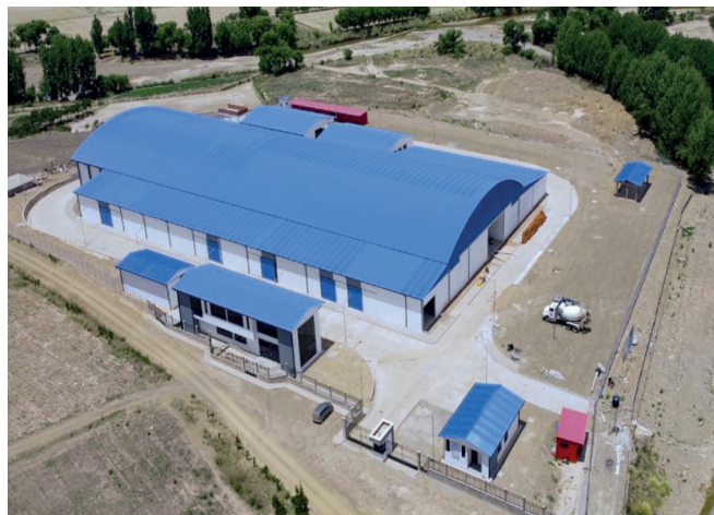
INCAHUASI , Planta Procesadora de Papa. Inversión: Bs158,75 millones.