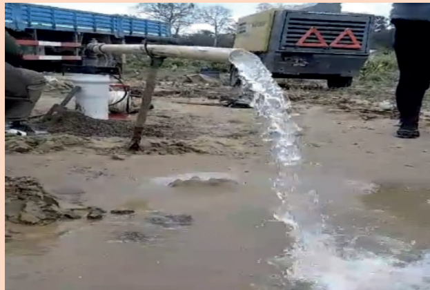
ATIOC GUARANÍ CHAQUEÑO DE HUACAYA: Comunidad Camatindi.