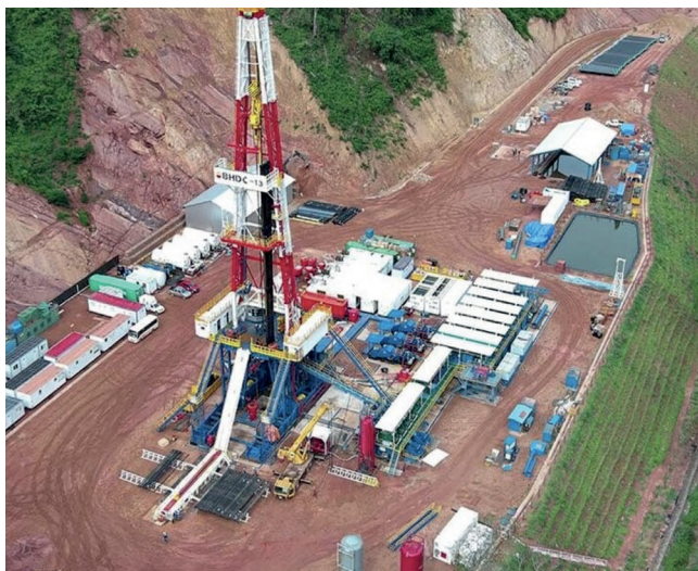
Exploración Pozo Iñau-X3D en Chuquisaca (Luis Calvo) Inversión: Bs544,98 millones.