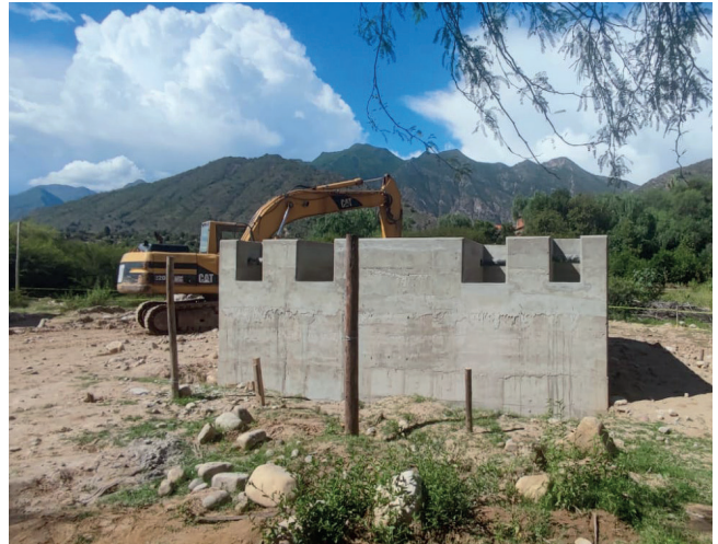
GAM ICLA: Construcción Puente Peatonal Sector Parronal Comunidad Uyuni.