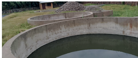
GAM CARRERAS, Construcción Sistema Alcantarillado Sanitario Las Carreras.