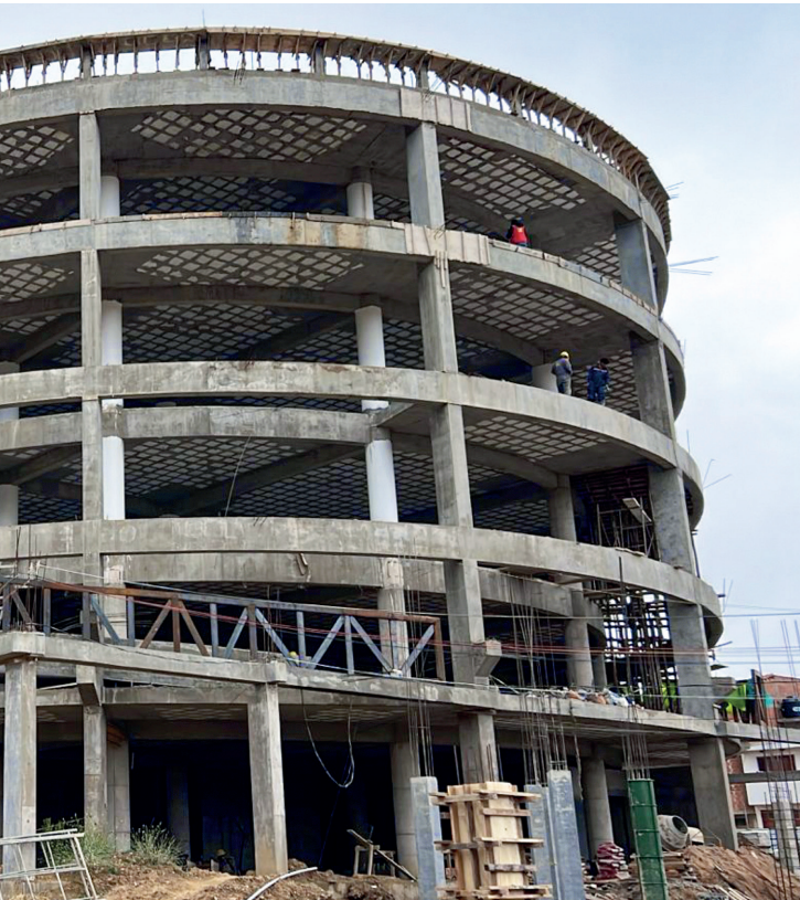
CONSTRUCCIÓN DEL EDIFICIO DE ARCHIVO Y BIBLIOTECA NACIONAL - MUNICIPIO DE SUCRE.