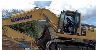
GAM PRESTO, Equipamiento Maquinaria Pesada.