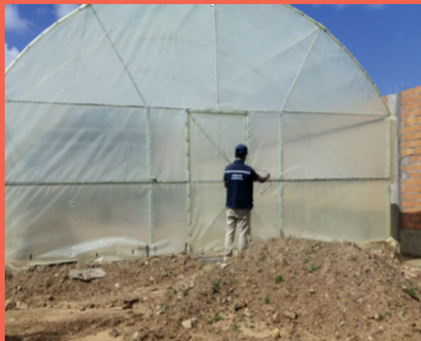
Implementación de invernaderos, Municipio de Sucre.