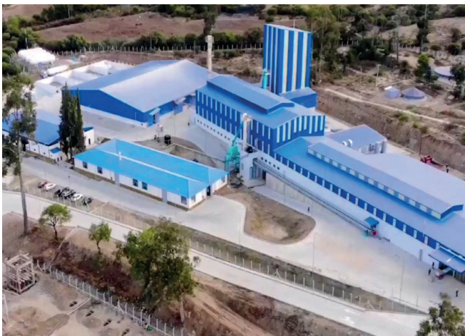
VILLA ZUDÁÑEZ , Ampliación de la Planta de Envases de Vidrio de Bolivia (ENVIBOL). Inversión: Bs260,70 millones.