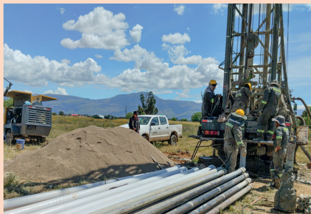
GAM POROMA: Comunidad Ollisco 1 y 2.