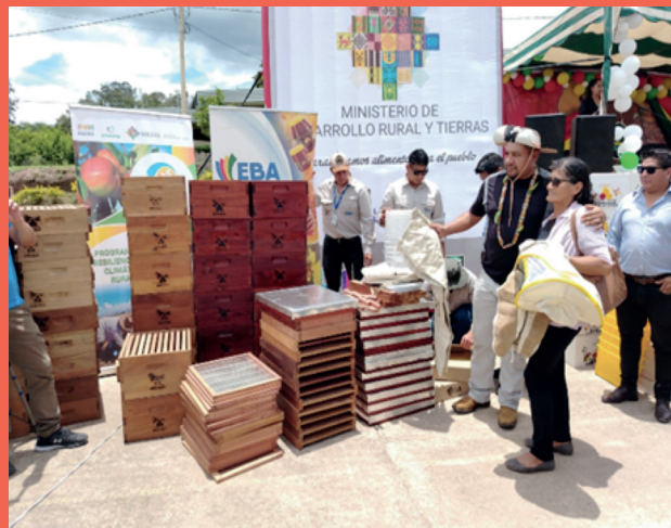
Entrega de paquetes tecnológicos a apicultores del Chaco Chuquisaqueño, Municipio de Montegudo.