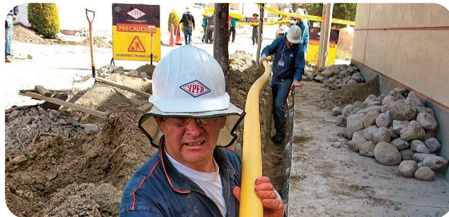
CONSTRUCCIÓN REDES DE GAS DOMICILIARIO BENI Inversión: Bs466,8 millones*