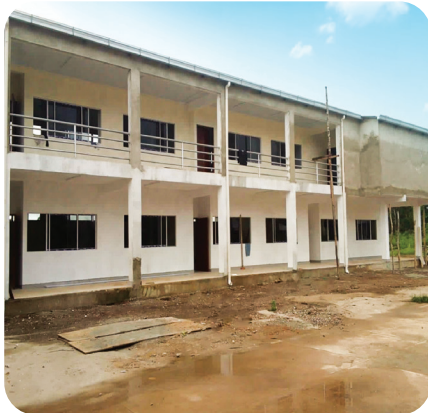
CONSTRUCCIÓN UNIDAD EDUCATIVA SIMÓN BOLÍVAR - BAURES