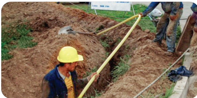
CONSTRUCCIÓN REDES DE GAS EN TRINIDAD MEDIANTE EL SISTEMA VIRTUAL Inversión: Bs157,9 millones*

**El proyecto tiene alcance en 2 departamentos de Bolivia.