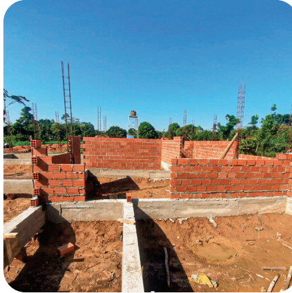
CONSTRUCCIÓN UNIDAD EDUCATIVA 27 DE MAYO - LORETO