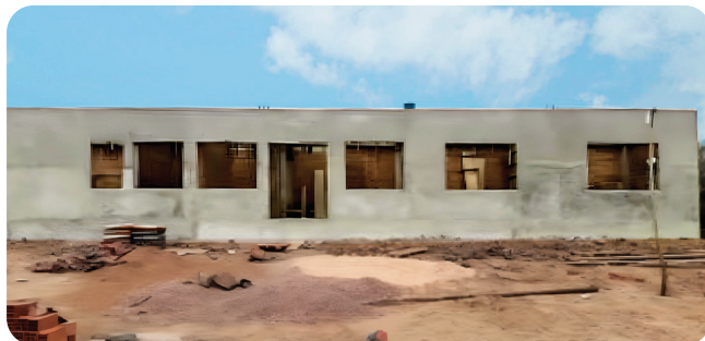
SAN ANDRÉS , Planta de Agroinsumos Inversión: Bs46,4 millones*