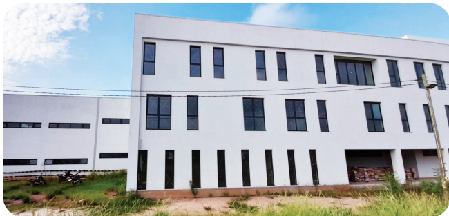
CONSTRUCCIÓN HOSPITAL DE TERCER NIVEL DE TRINIDAD Inversión: Bs514,5 millones*