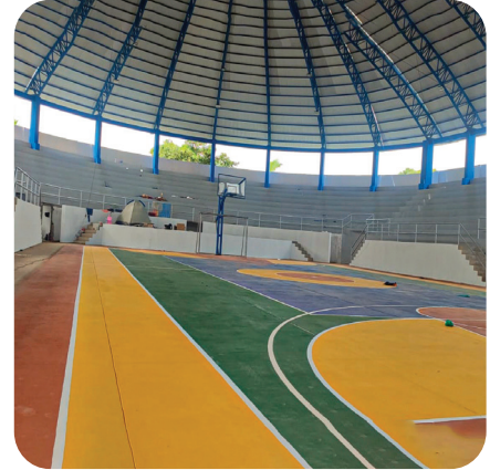
CONSTRUCCIÓN COLISEO CERRADO JOSÉ ELÍAS CRUCO SIMÓN - SANTA ROSA