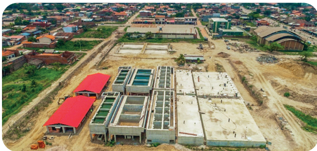
CONSTRUCCIÓN PLANTA DE TRATAMIENTO DE AGUA POTABLE CIUDAD DE TRINIDAD Inversión: Bs177,2 millones*