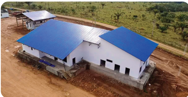
PUERTO RURRENABAQUE , Planta Piscícola Inversión: Bs85,1 millones*