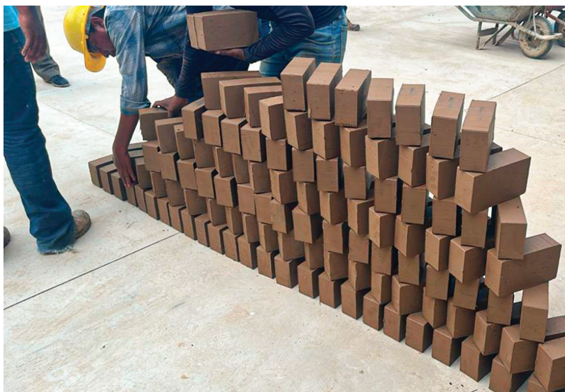
FÁBRICA DE LADRILLOS, TRINIDAD