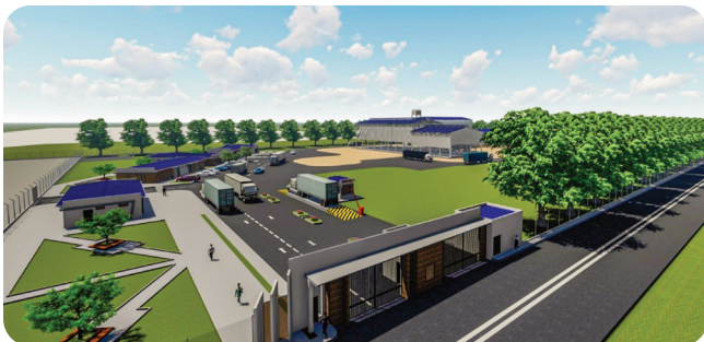
SAN BORJA , Planta Procesadora de Extracción de Aceite Vegetal y Aditivos Inversión: Bs164,3 millones*