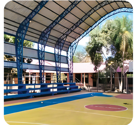
CONSTRUCCIÓN TINGLADO Y CANCHA POLIFUNCIÓN UNIDAD EDUCATIVA MACEDONIO PAZ PINO - MAGDALENA