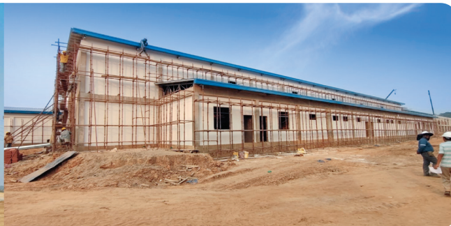
REYES Y SAN BORJA , Industria de Cárnicos Inversión: Bs294,0 millones*

*Contempla la inversión total del proyecto.