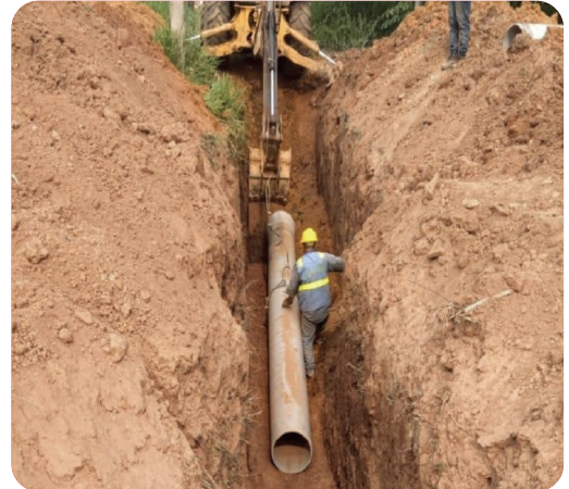
MMAyA: CONSTRUCCIÓN SISTEMA DE AGUA POTABLE Y ALCANTARILLADO SANITARIO RIBERALTA