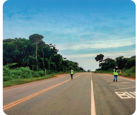
ABC: CONSTRUCCIÓN CARRETERA RURRENABAQUE - RIBERALTA