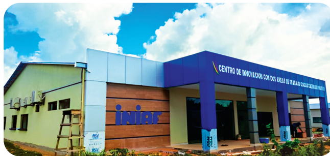
CONSTRUCCIÓN Y EQUIPAMIENTO CENTRO DE INNOVACIÓN DE CACAO CULTIVADO Y NATIVO EN BENI Y LA PAZ** Inversión: Bs43,3 millones*

**El proyecto tiene alcance en 2 departamentos de Bolivia.