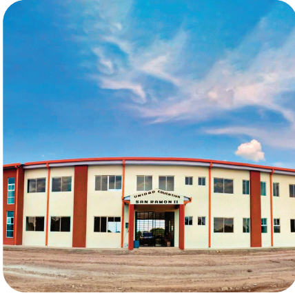
CONSTRUCCIÓN UNIDAD EDUCATIVA SAN RAMÓN II - SAN RAMÓN

El Gobierno Nacional a través de la Unidad de Proyectos Especiales (UPRE) en el marco del Programa Bolivia Cambia, implementa proyectos en el ámbito municipal, regional y social, en el Departamento de Beni, con una Inversión total de Bs81,8 millones , se priorizó la ejecución de 31 proyectos en beneficio de 13 municipios de la siguiente manera: Baures (3), Exaltación (3), Loreto (2), Magdalena (3), Puerto Guayaramerín (4), Puerto Rurrenabaque (2), Puerto Siles (1), San Andrés (1), San Borja (2), San Javier (1), San Ramón (2), Trinidad (5) y Santa Rosa (2).