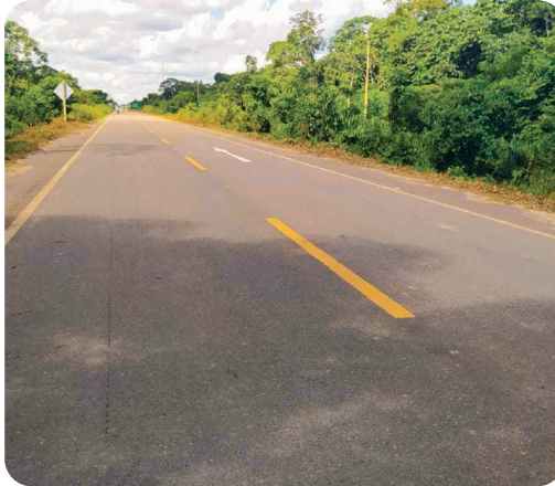
ABC: CONSTRUCCIÓN CARRETERA SAN IGNACIO – PUERTO GANADERO

GAM DE RIBERALTA 1 Proyecto Inversión: Bs59,0 millones