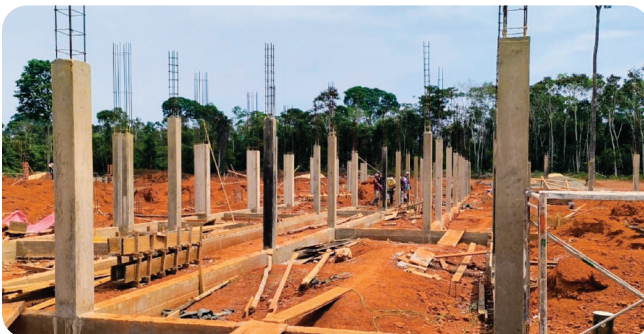
RIBERALTA , Planta de Industrialización de Almendra Inversión: Bs74,8 millones*