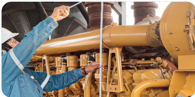
MEJORAMIENTO DEL SUMINISTRO DE ENERGÍA ELÉCTRICA, OBRAS CIVILES Y SUBESTACIÓN RIBERALTA Inversión: Bs80,6 millones*

* Contempla la inversión total del proyecto.