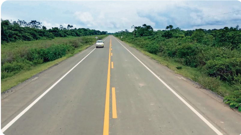
ABC: CONSTRUCCIÓN CARRETERA SAN BORJA - SAN IGNACIO DE MOXOS