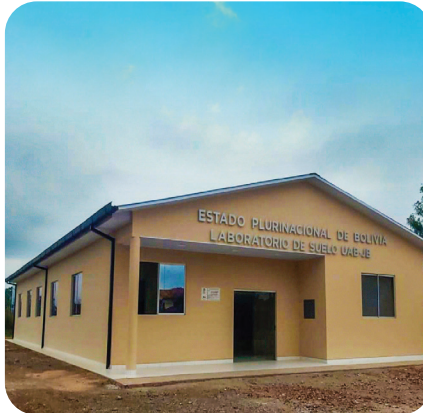
CONSTRUCCIÓN LABORATORIO DE SUELOS UNIVERSIDAD AUTÓNOMA DEL BENI JOSÉ BALLIVIÁN - TRINIDAD