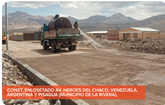
CONST. ENLOSETADO AV. HEROES DEL CHACO, VENEZUELA, ARGENTINA Y PISAGUA (MUNICIPIO DE LA RIVERA).

* Contempla la Inversión Total del proyecto.