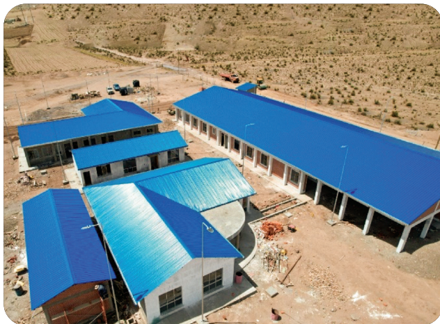
Planta Industrial de Camélidos en el Municipio de Turco.