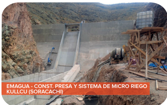
EMAGUA - CONST. PRESA Y SISTEMA DE MICRO RIEGO KULLCU (SORACACHI)

GAM DE MACHACAMARCA Construcción Sistema de Riego Tecnificado Sora. Bs317.342