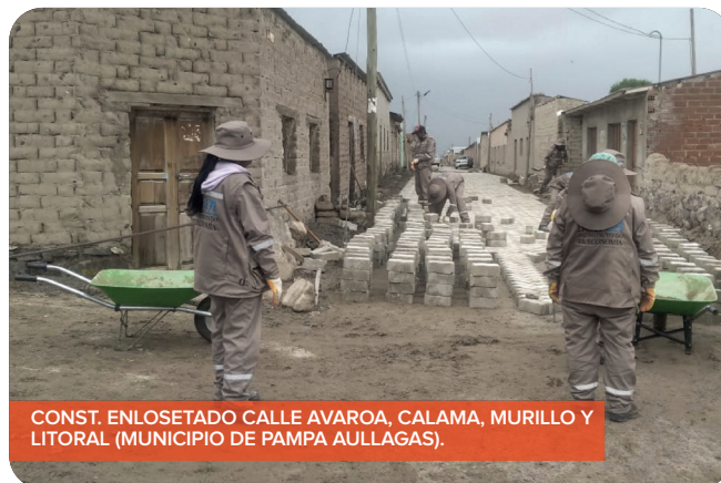
CONST. ENLOSETADO CALLE AVAROA, CALAMA, MURILLO Y LITORAL (MUNICIPIO DE PAMPA AULLAGAS).