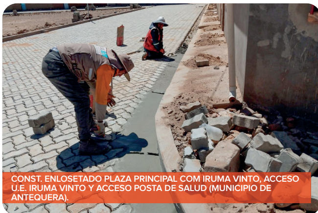
CONST. ENLOSETADO PLAZA PRINCIPAL CON IRUMA VINTO, ACCESO U.E. IRUMA VINTO Y ACCESO POSTA DE SALUD (MUNICIPIO DE ANTEQUERA).

A través del Programa Nacional de Emergencia para la Generación de Empleo Bol-34 , el Gobierno Nacional contribuye a la reactivación económica mediante la generación de empleo temporal para sectores vulnerables de la población, con proyectos de infraestructura urbana y rural de pequeña escala. En el departamento de Oruro, se llevará a cabo el enlosetado de 400.174,8 metros cuadrados que beneficiarán a 73.597 habitantes. Esta iniciativa tiene como objetivo primordial el favorecer a Gobiernos Autónomos Municipales, Gobiernos Autónomos Originario Campesino, Juntas Vecinales y otras organizaciones sociales.