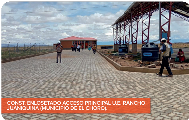
CONST. ENLOSETADO ACCESO PRINCIPAL U.E. RANCHO JUANIQUINA (MUNICIPIO DE EL CHORO).