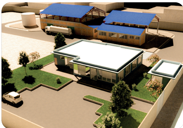
Centro de Acopio y Almacenaje de Residuos Líquidos, Dpto. de Oruro - Municipio de Oruro.