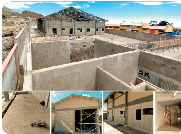
Ampliación de la Planta de Procesamiento de Lácteos en el Municipio de Challapata.