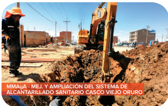
MMaYA - MEJ. Y AMPLIACIÓN DEL SISTEMA DE ALCANTARILLADO SANITARIO CASCO VIEJO ORURO

Con el Fideicomiso de Apoyo a la Reactivación de la Inversión Pública - FARIP en Oruro se prioriza Bs48,6 millones para financiar 16 proyectos de 7 municipios y la Gobernación .