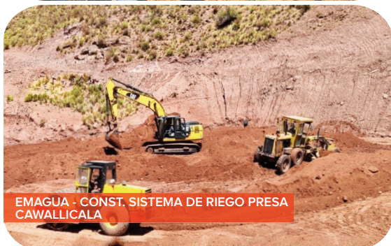
EMAGUA - CONST. SISTEMA DE RIEGO PRESA CAWALLICALA

GAM DE HUANUNI Construcción Presa - Sistema Riego Huayllapampa. Bs497.032