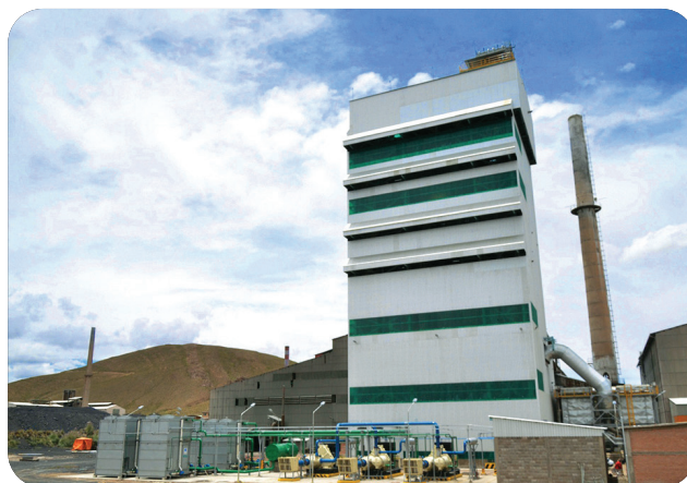
Planta de Refinación de Zinc, Vinto - Oruro.